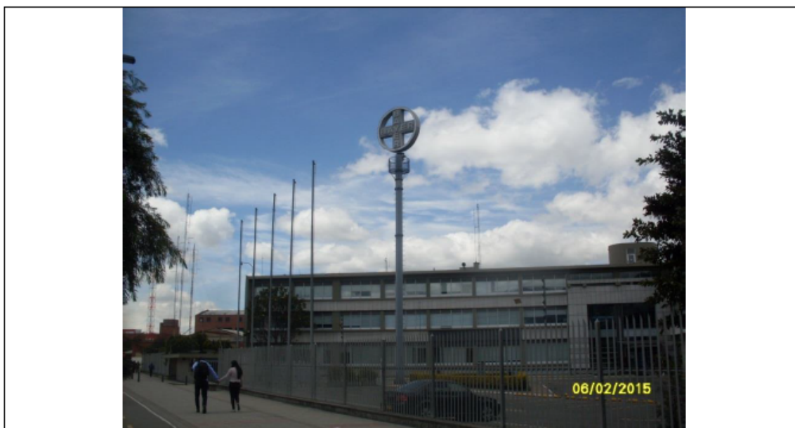
VISTA PANORÁMICA Y DE LA PUBLICIDAD AVENIDA AMERICAS NO 55 - 80 SENTIDO ESTE – OESTE